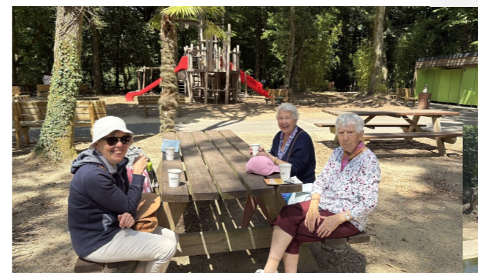
1ère sortie estivale !