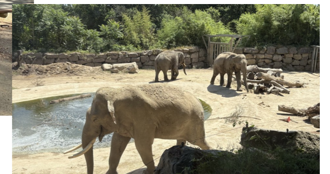
Les Terres de Nataé le 26 juin