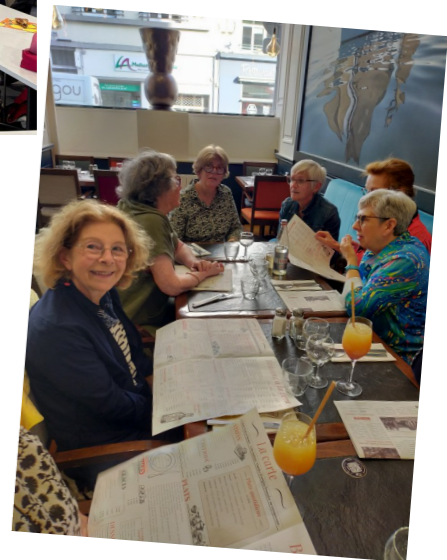
Un apéro plaisir