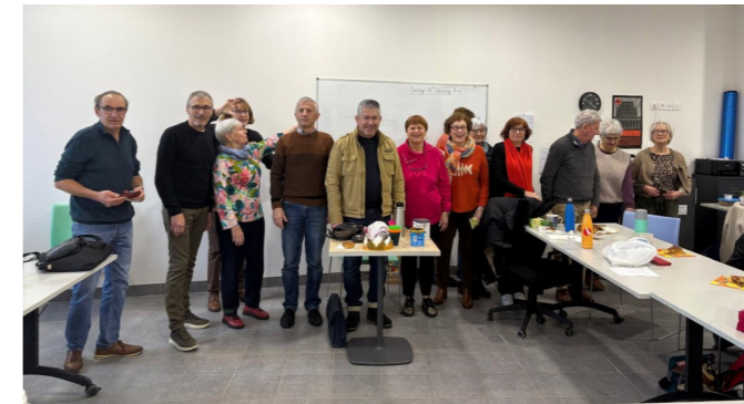
Galette des rois en Anglais