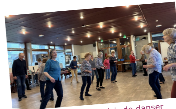
Un après-midi à Plaisir de danser